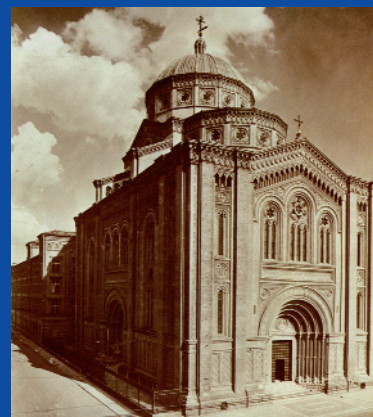
Parrocchia Sacro Cuore

Scuola Secondaria di 1° grado (Media) Istituto Professionale Meccanico Istituto Professionale Grafico Pubblicitario Istituto Tecnico Elettronico-Telecomunicazioni Liceo Scientifico Centro di Formazione Professionale