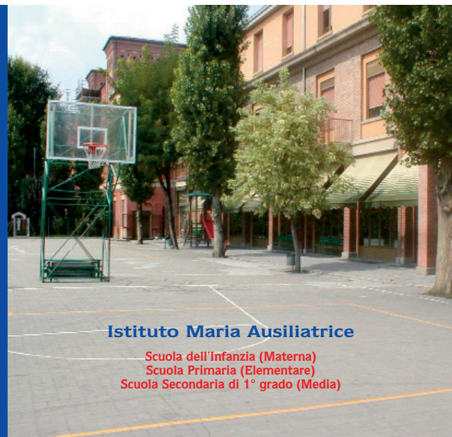
Istituto Maria Ausiliatrice

Scuola dell'Infanzia (Materna) Scuola Primaria (Elementare) Scuola Secondaria di 1° grado (Media)