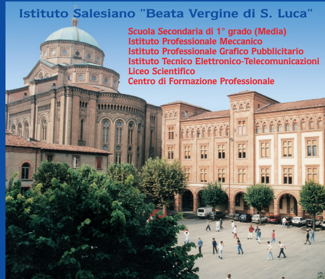
Istituto Salesiano "Beata Vergine di S. Luca"

Scuola dell'Infanzia (Materna) Scuola Primaria (Elementare) Scuola Secondaria di 1° grado (Media)