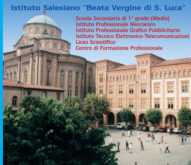
Istituto Salesiano "Beata Vergine di S. Luca"

Scuola dell'Infanzia (Materna) Scuola Primaria (Elementare) Scuola Secondaria di 1° grado (Media)