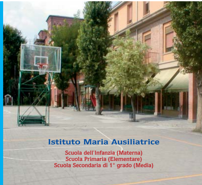
Istituto Maria Ausiliatrice

Scuola dell'Infanzia (Materna) Scuola Primaria (Elementare) Scuola Secondaria di 1° grado (Media)